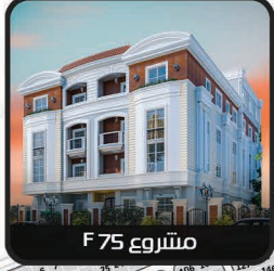
مشروع F 75